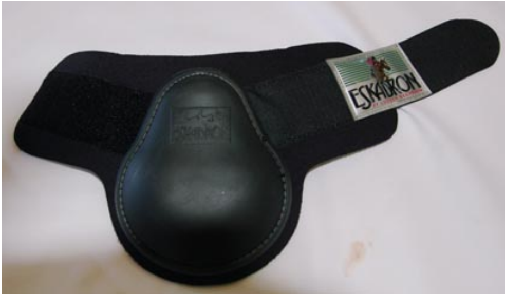
Exemplo: MODELOS DE BOLETEIRAS PROIBIDAS