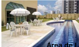
Área de Lazer