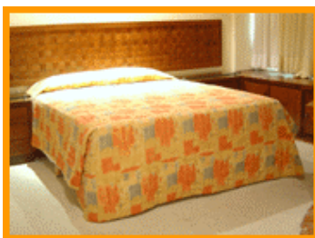
Quarto – Suíte King