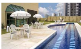
Área de Lazer