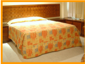
Quarto – Suíte King